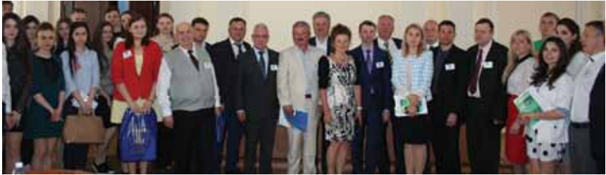
Участники Международной научно-практической конференции «Современные правовые системы мира: тенденции и факторы развития», Киевский национальный университет технологии и дизайна. 25 мая 2017 г.