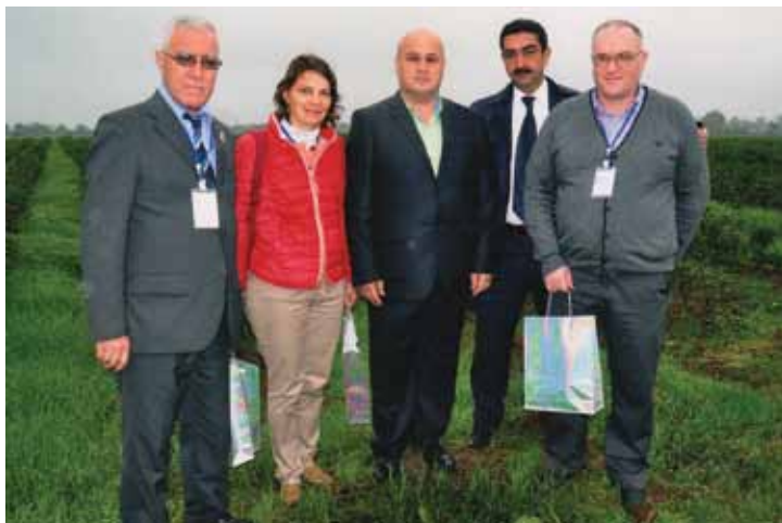
Участники Бакинского IV международного гуманитарного форума на чайных плантациях в Азербайджане г. Ленкоран