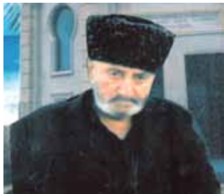
Сейид Юсиф Ага