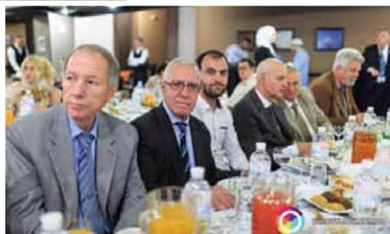
Во время Ифтар месяца Рамадан, организованного Духовным управлением мусульман Украины, 2018 г.