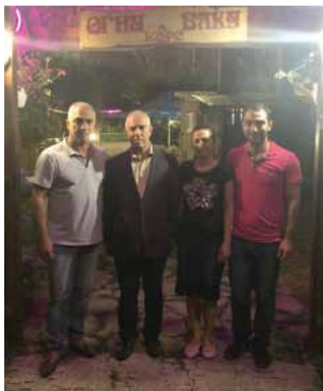
Родные в городе Винница вспоминают с друзьями Бакинские красоты