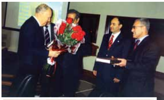
Поздравление с днем рождения президента НАН Украины Бориса Патона