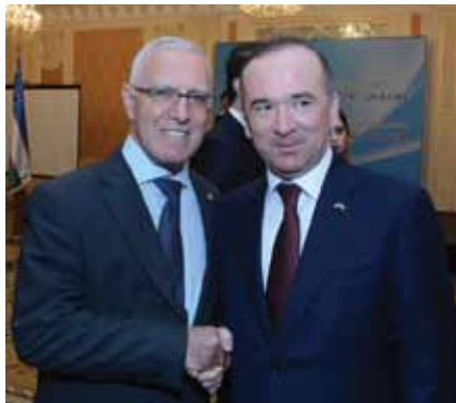
С другом Чрезвычайным и Полномочным послом Республики Узбекистан в Украине Алишером Абдуалиевым