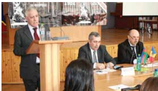
Участники Международной научно-практической конференции «Политика двойных стандартов в разрешении территориальных конфликтов» в Кишинэу, 25 февраля 2016 г.