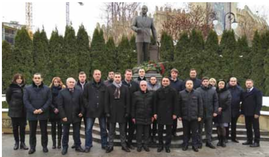
12 декабря 2017 года. Азербайджанский коллектив «SOCAR» в день памяти общенационального лидера Гейдара Алиева возле его памятника в г. Киеве