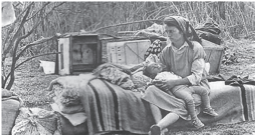
Азербайджанські біженці з району нагірнокарабаського конфлікту, 1993 рік

Біда в тому, що тероризм став істотним компонентом сучасних збройних конфліктів у багатьох країнах світу. До теми міжнародного тероризму я маю безпосередній стосунок, бо коли жив у Азербайджані, практично щодня стикався з проявами тероризму у вірмено-азербайджанському нагірнокарабаському конфлікті. Коли працював у державних органах, доводилося брати участь у розміщенні біженців і переселенців — вигнаних із рідних земель — Вірменії та Нагірного Карабаху азербайджанців. У кожному місті чи районному центрі там є кладовища — алеї «шехидів», моїх співвітчизників, які загинули від рук вірменських сепаратистів у Нагірному Карабаху. Монографію я присвятив пам'яті невинних людей, які стали «мішенями» терористів.