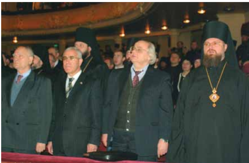
С украинскими друзьями