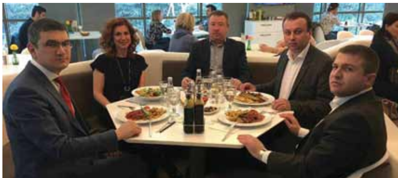
Украинские друзья за чайным столом беседуют о сотрудничестве с коллегой в Турции