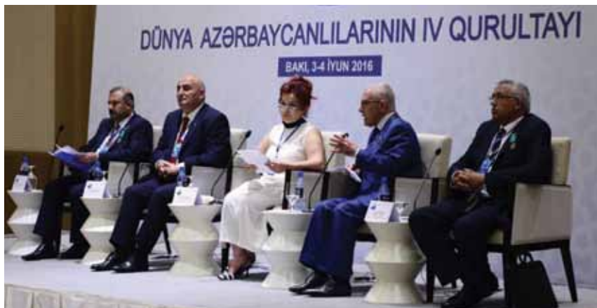
Выступление на IV Съезде азербайджанцев мира