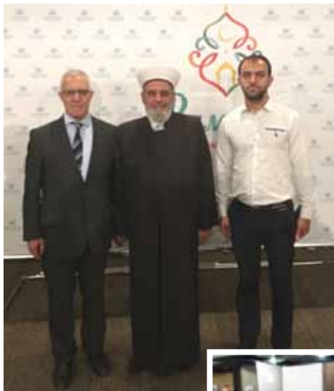
Ариф Гулиев, муфти духовного управления мусульман Украины, шейх Ахмед Тамим и Акшин Гулиев во время ифтара в честь праздника Рамазана в г. Киеве