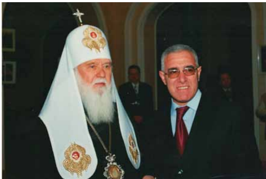
Святейший Патриарх Киевский и всея Руси-Украины Филарет и Ариф Гулиев