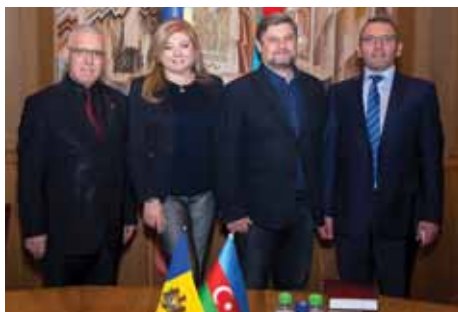
Объединение Азербайджанской, Молдавской и Израильской дружбы