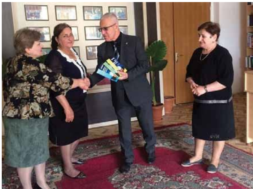
Отчет родной Бардинской электронной библиотеке