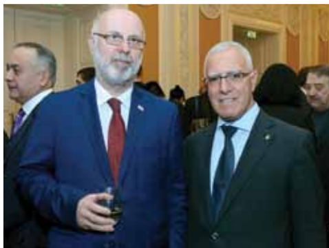
С другом Чрезвычайным и Полномочным послом Грузии Григолой Катамадзе