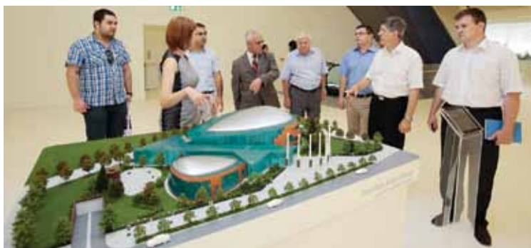
С друзьями, украинскими учеными в Центре Гейдара Алиева