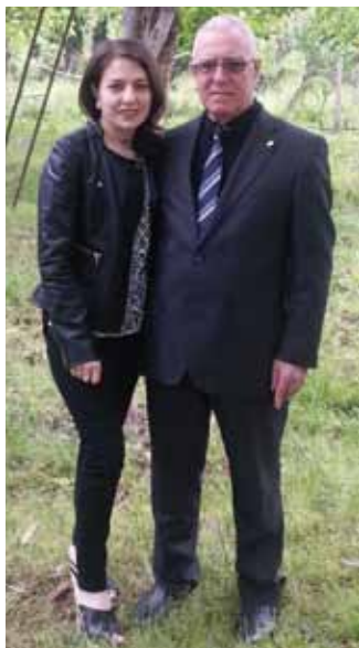
В Бардинском родном саду