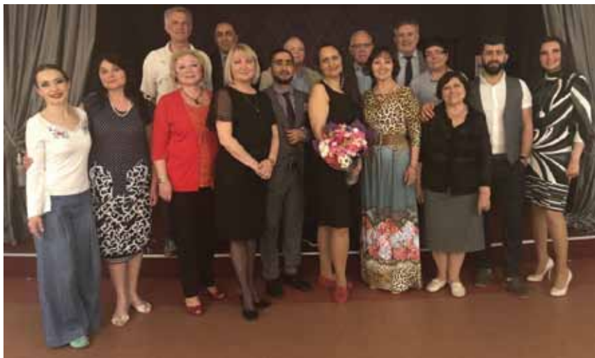
Вместе с комиссией, отметившей заслуги Народного коллектива «Школа кавказских танцев»