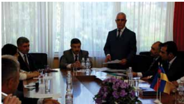
Открытие I конференции общественной организации «Совет ученых азербайджанцев Украины»