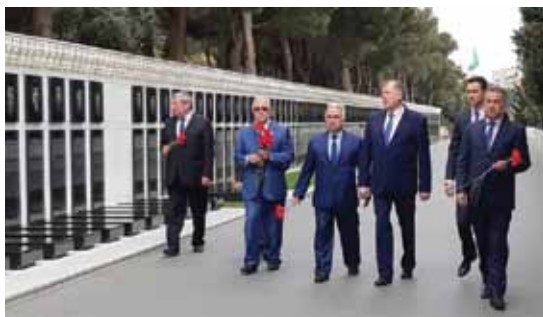
Почтение памяти в Шехидляр хиябаны героических сынов и дочерей, павших за независимость и территориальную целостность Азербайджана, к мемориалу «Вечный огонь»