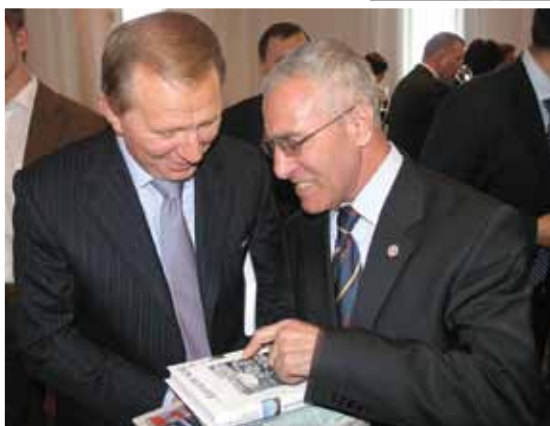
С большим другом азербайджанцев Украины Леонидом Кучмой