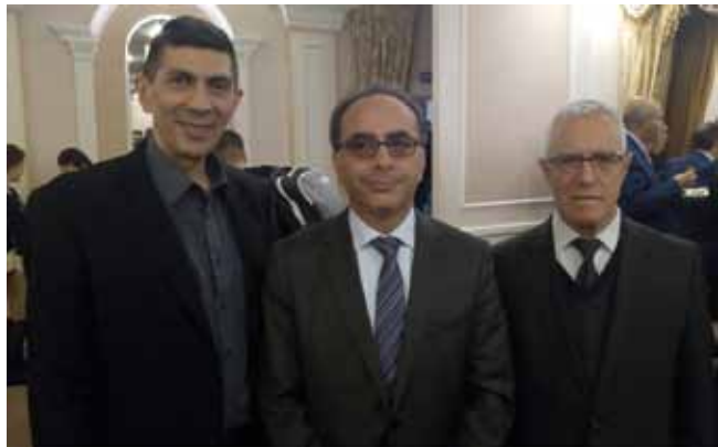
Ариф Гулиев, Чрезвычайный и Полномочный Посол Турции Йонет Тезель и врач-земляк Али Багиров