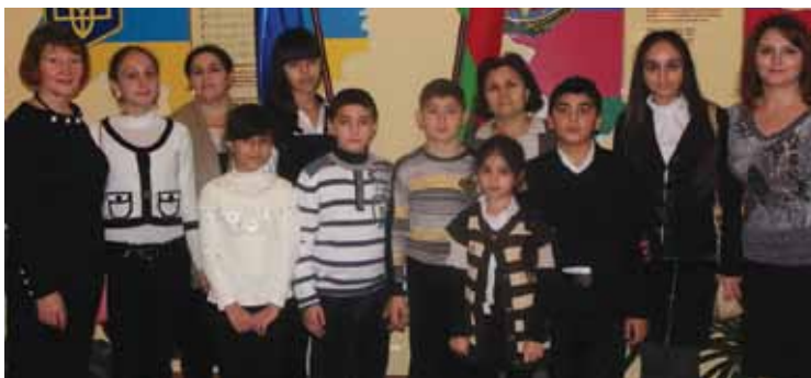
Юные украинские азербайджанцы в библиотеке им. Самеда Вургунга в г. Киеве изучают государственные символы Украины и Азербайджана