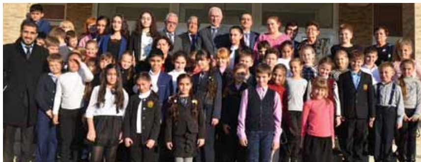
Ученики азербайджанских классов после торжественных мероприятий в честь 25-летия независимости Азербайджана