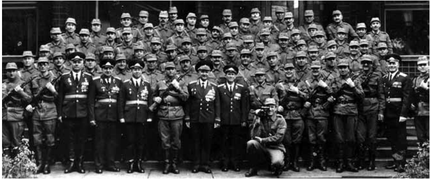
Первое окружение в Киеве: слушатели 10-го курса Суворовского училища, сентябрь – октябрь 1989 г.