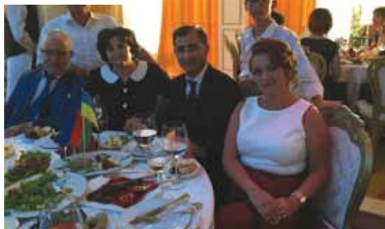
Молдавские встречи с друзьями