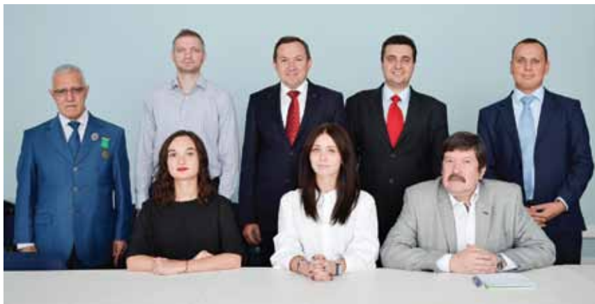
Коллектив кафедры международного права Учебно-научного Института международных отношений Национального авиационного университета