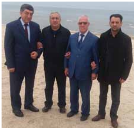
Друзья в окружении Каспийской красотой