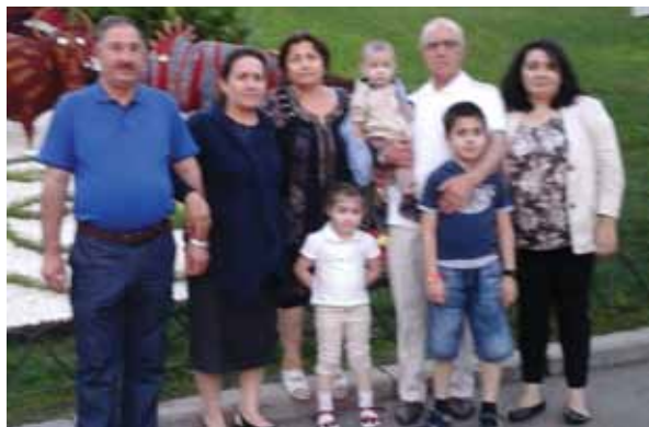
С родственниками прогулки в День цве- тов в парке Славы, г. Киев