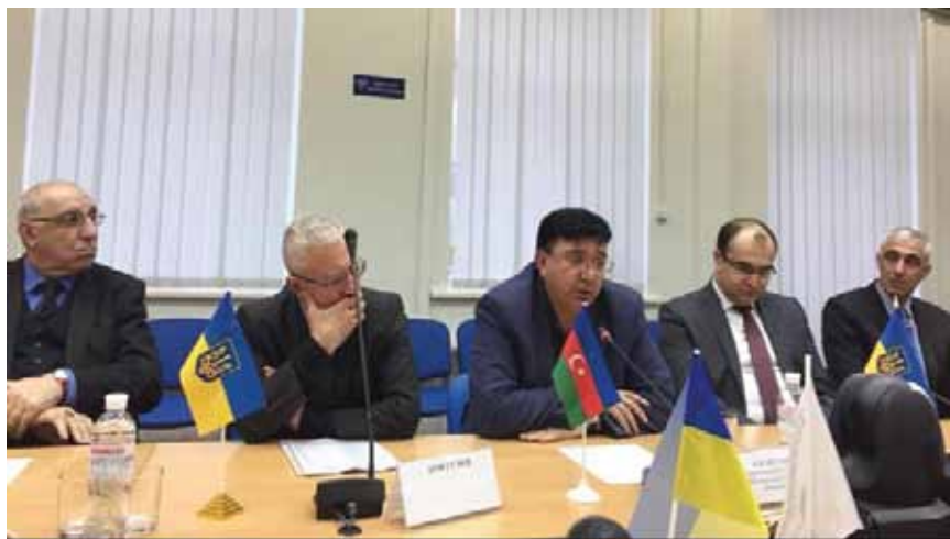
Земляки за круглым столом, посвященного трагическим событиям организованного армянами Ходжалинского геноцида азербайджанцев (26.2.1992 г.) в Нагорном Карабахе Азербайджана