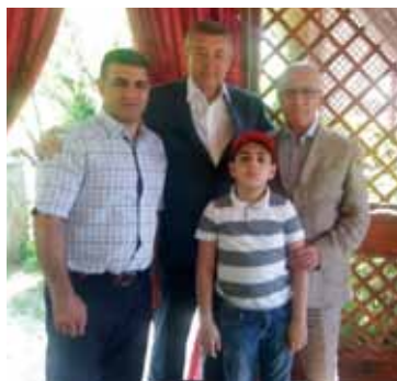
Можно гордиться 20-летней надежной дружбой