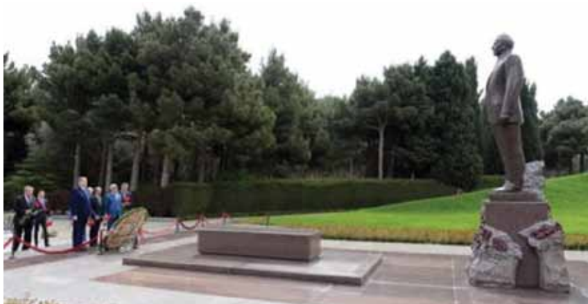
Украинская делегация посетила Аллею почетного захоронения, могилу общенационального лидера, архитектора и создателя современного независимого Азербайджанского государства Гейдара Алиева в честь его 95-летия